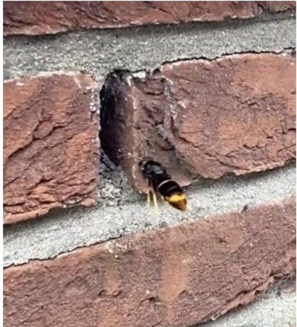
Aziatische hoornaar met een nest in de spouw van een muur in Puttershoek 30 april 2024

Rond de tijd van het verschijnen van deze Tuinpraat hebben de hoornaars nog een primair nest. Dit is een nest dat kan uitgroeien tot de grootte van een voetbal en zit meestal niet hoger dan 3 meter ergens in een beschutte plek.