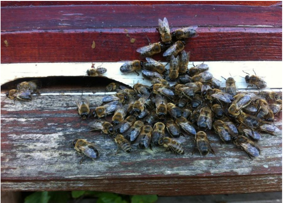
Darrenslacht: naar buiten gedreven en de toegang ontzegd