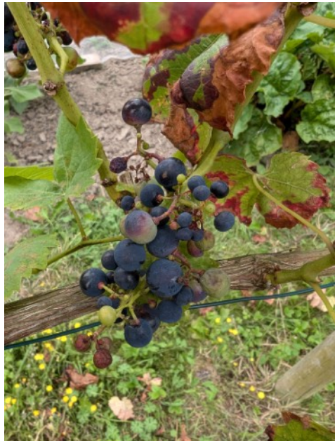
Door valse meeldauw aangetaste druiventros