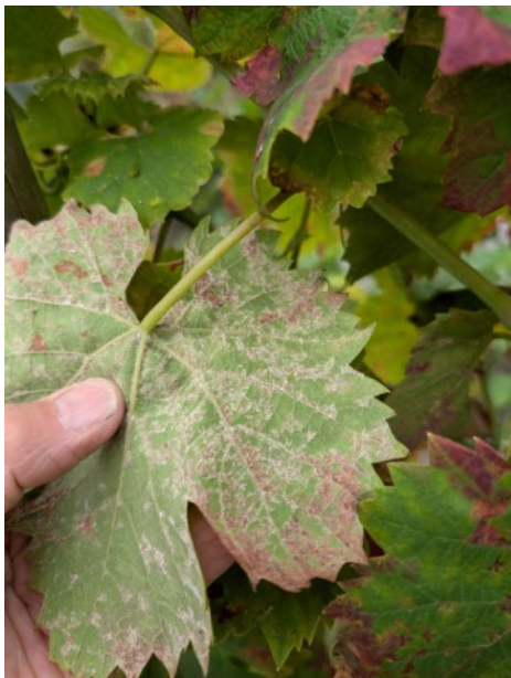
Onderzijde van een door valse meeldauw aangetast druivenblad

Valse meeldauw in druiven is een vrij hardnekkige schimmel. Hij blijft over in afgevalen bladeren en andere resten op de grond. In het voorjaar, wanneer aan bepaalde voorwaarden is voldaan (meer dan 10°C, meer dan 10 mm regen gedurende 48 uur of meer) treedt infectie op.