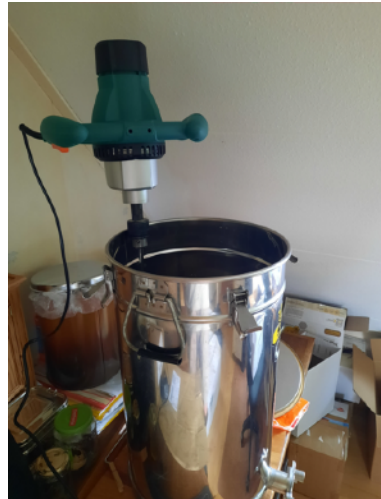
Mortier (vijzel met stamper)

Onderaan de staaf van de roermachine zit een speciaal kop die de honing in beweging brengt zonder dat er lucht in de honing getrokken wordt.