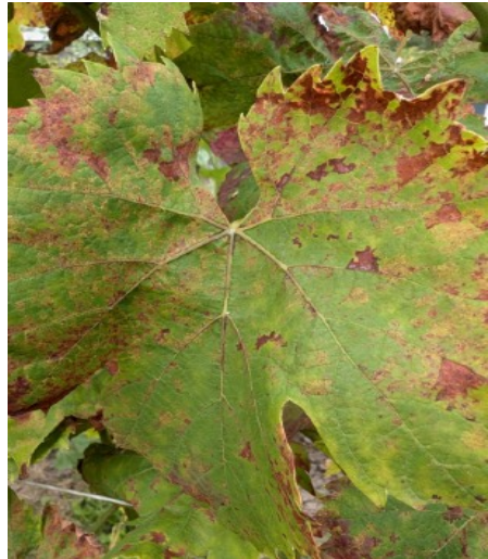
Bovenzijde van een door valse meeldauw aangetast druivenblad

Gelukkig biedt Google ook in dit soort zaken uitkomst: dit was valse meeldauw, met de Latijnse naam Peronospora viticola . In Frankrijk noemt men dit Mildiou.